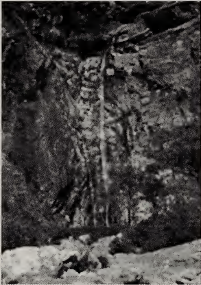
Habitat de H. pendula

distingue facilmente mesmo sem flores pela morfologia dos pseudobulbos e folhas, os primeiros claramente elípticos, afilando-se bruscamente na interseção das folhas, estas também elípticas e menos coriáceas do que todas as outras espécies do gênero, e mais planas do que as espécies afins. O nome deriva do latim pendulus , -a, -um = "que pende", alusão ao hábito peculiar desta espécie dentro do gênero, pois ocorre em paredões verticais, em posição não ereta, e com o escapo floral pendendo para uma posição horizontal.